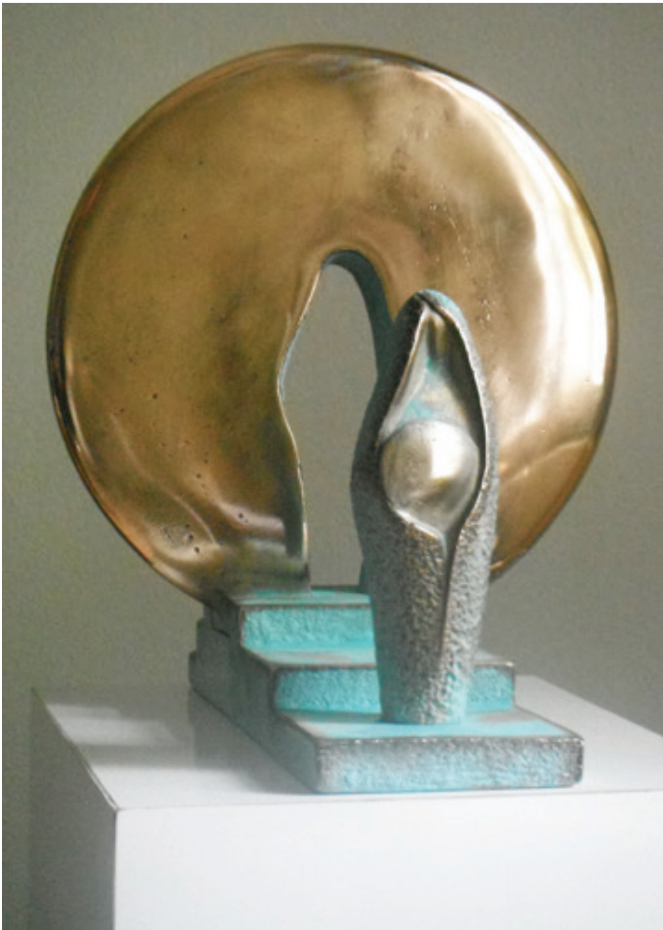
"ANNE VE ÇOÇUK" 1/6 (2006-2013) Bronz 32,5x31,5x28,5 cm