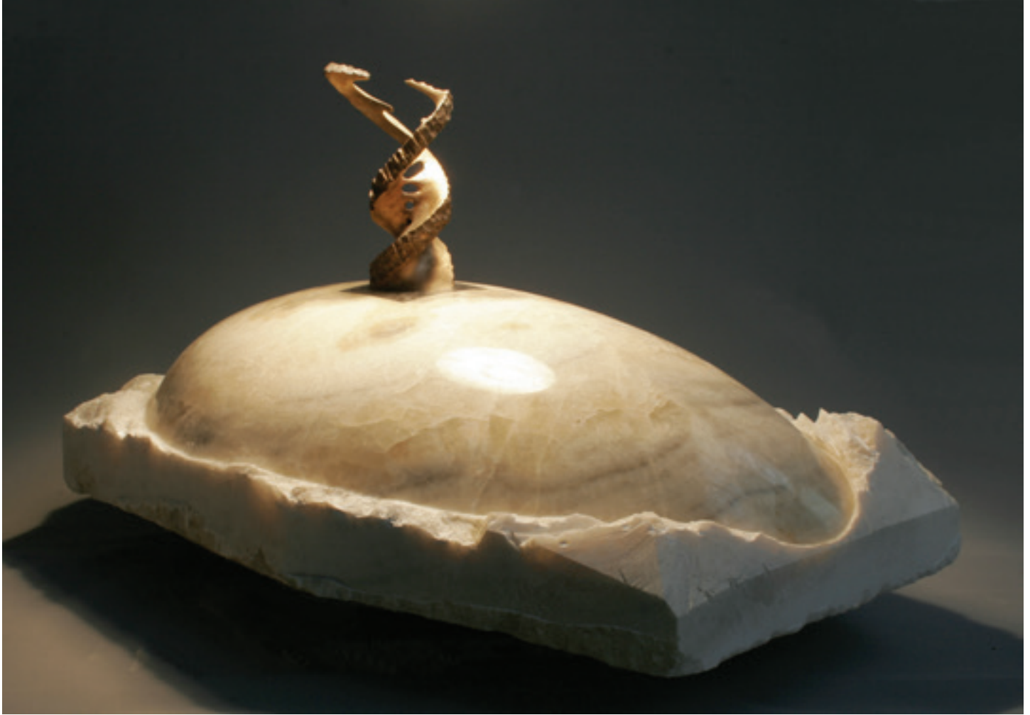
„ADSIZ“ 2010 Oniks, Siyah Mermer ve Bronz 54,5x67x103 cm