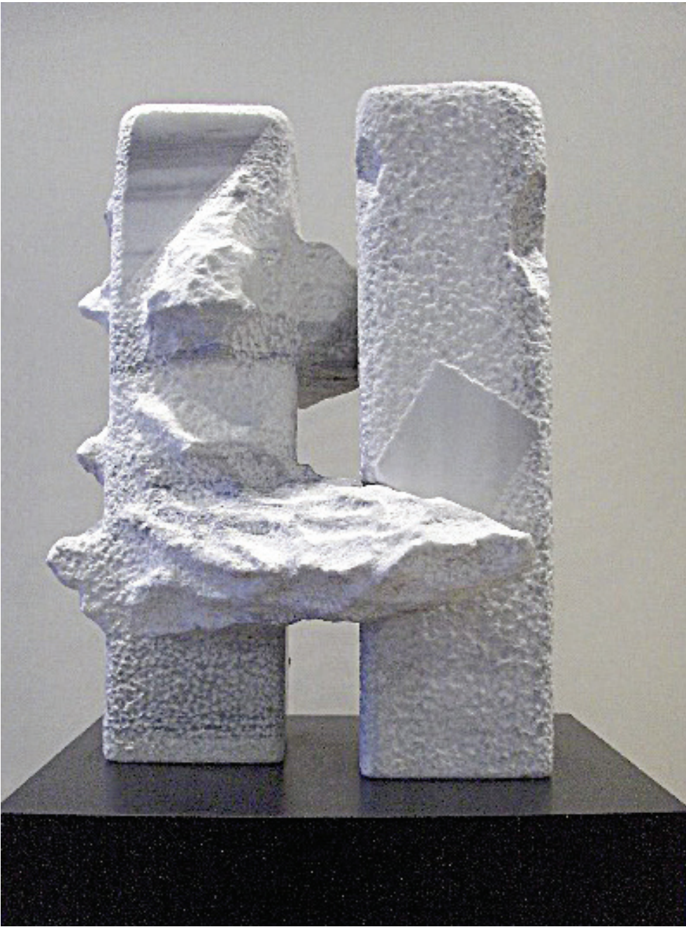
"ÖZGÜRLÜK VE SINIRLAR" 2005