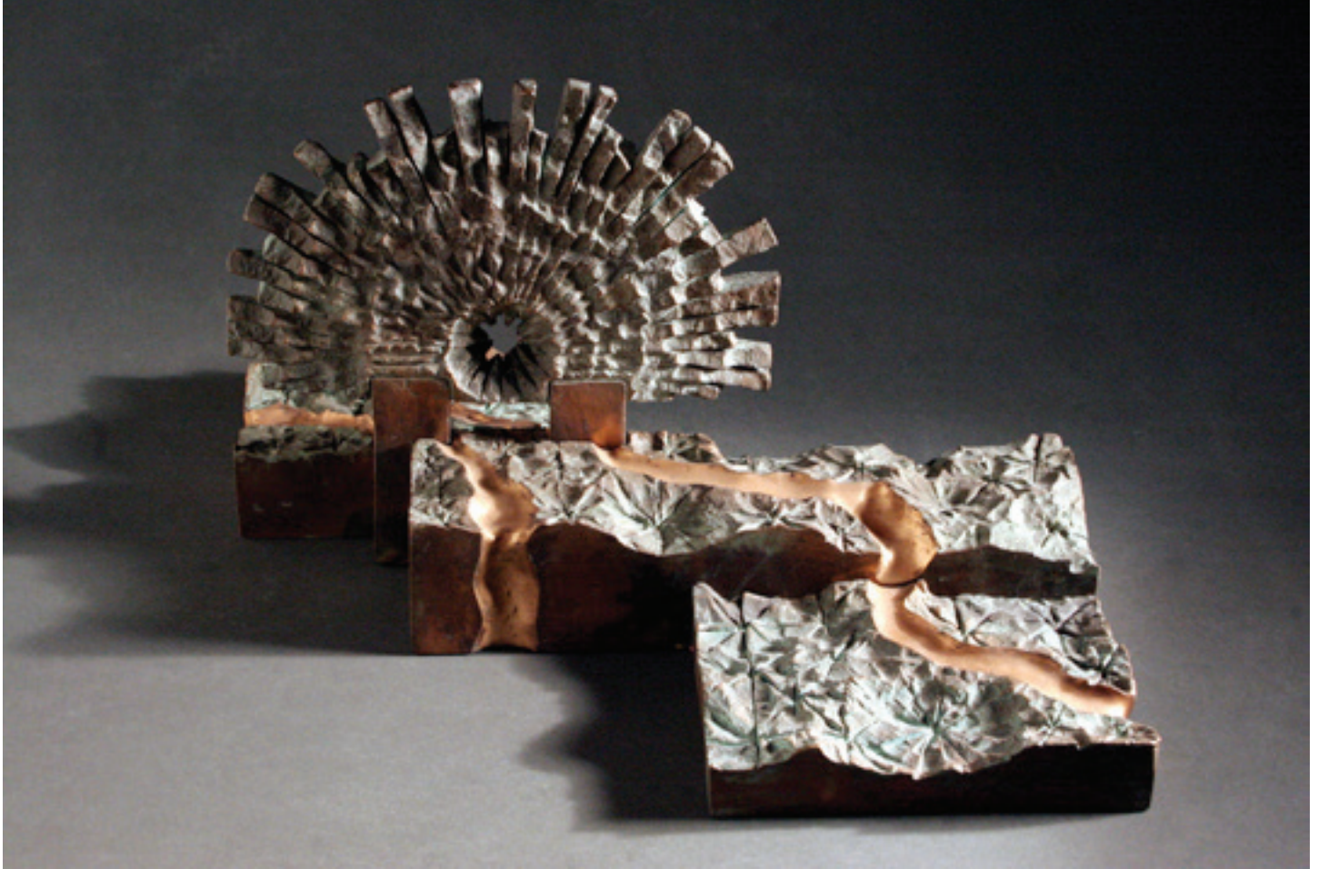
"İLKBAHAR" 3/6 (2003-2013) Bronz 19x31x29 cm