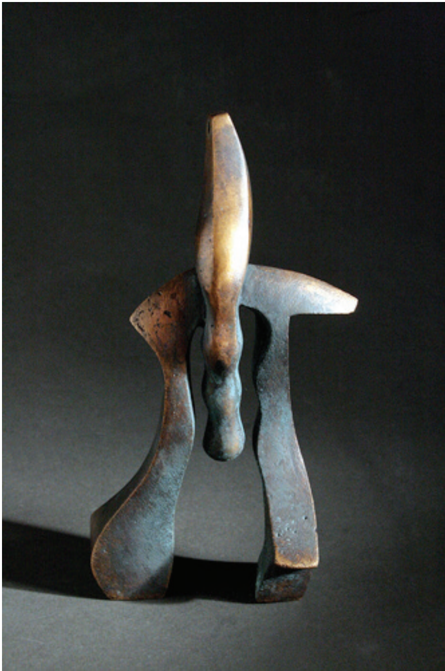
"BEKLEYİŞ" 3/8 (1997-2013) Bronz 19,5x11x6,5 cm