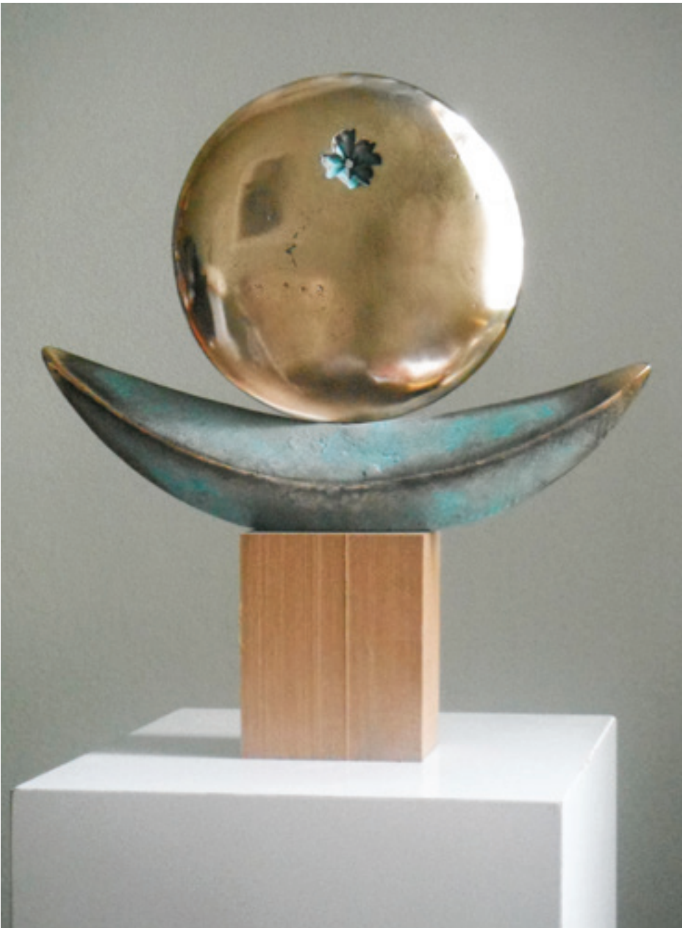
"TOROSUN GELİŞİ" 1/6 (2006-2013) Bronz ve Ahşap 37x33,5x7 cm