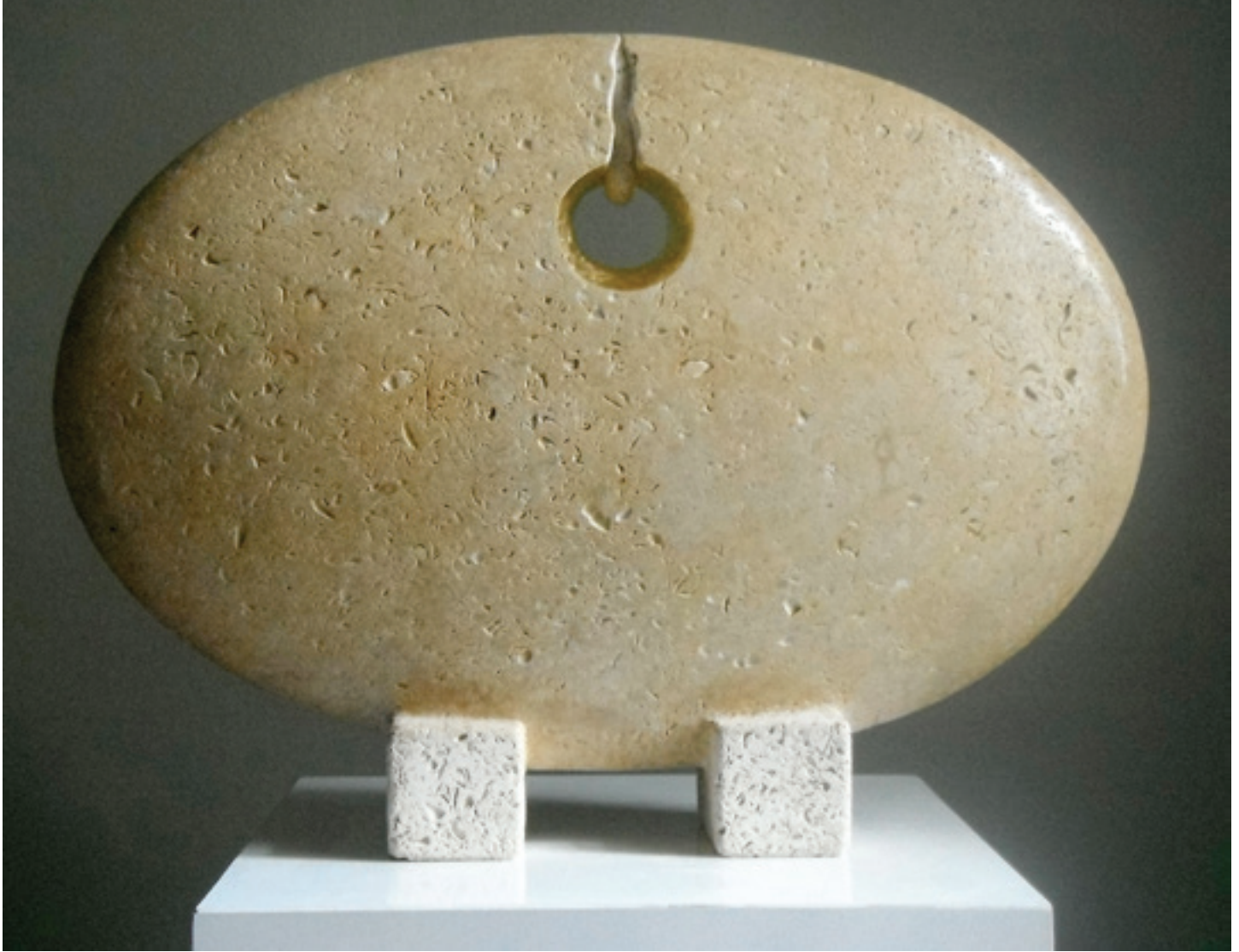
"MUCİZELER I" 2013 Kalker ve Altın Varak 60x44x12,5 cm