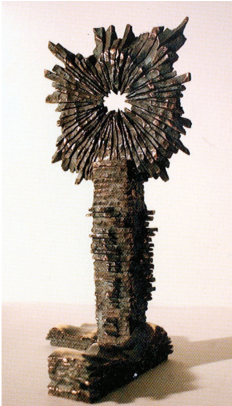
"SULAR DAĞLAR VE GÜNEŞ İÇİN" 2/6 (2001-2013)