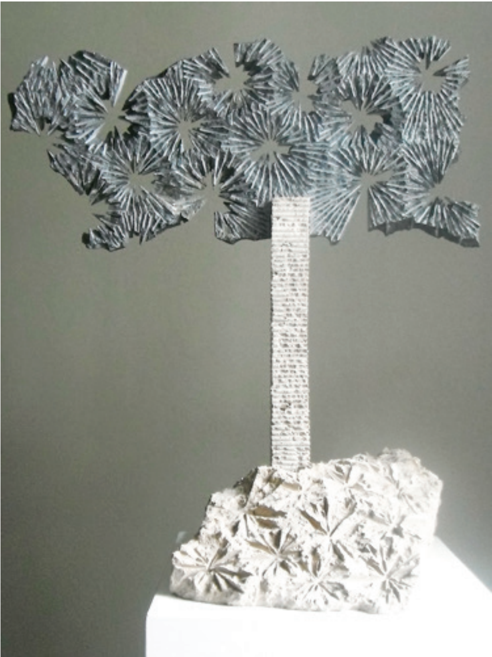
"SAMANYOLU" 2004 Siyah Mermer, Traverten ve Ahlat Taşı 75x55x35 cm