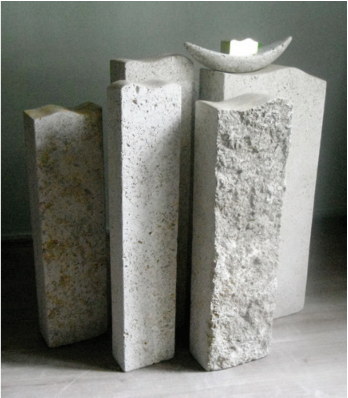
"SANATÇI" 2013 Kalker ve Altın Varak 99x95x55 cm