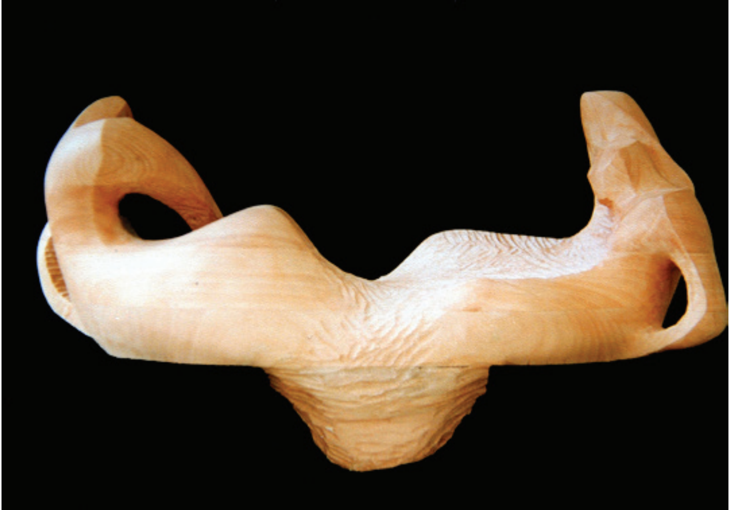
"İkili" 1994 Ahşap 60x40x110 cm