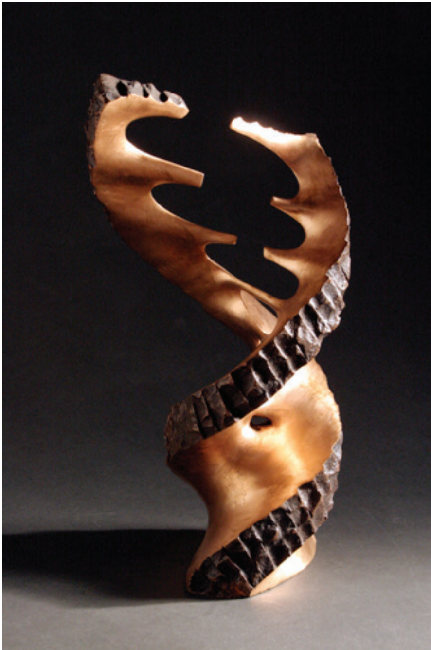
"EVREN HAKKINDA" 4/6 (2002-2013) Bronz 28,5x16x10 cm