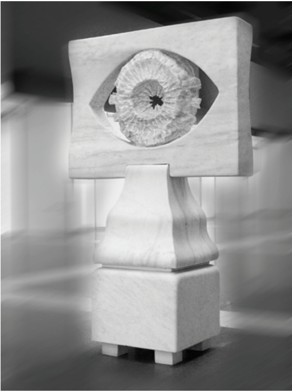
"GÖRMENİN ÜÇLÜSÜ-2" 2004 Mermer 165x100x50 cm