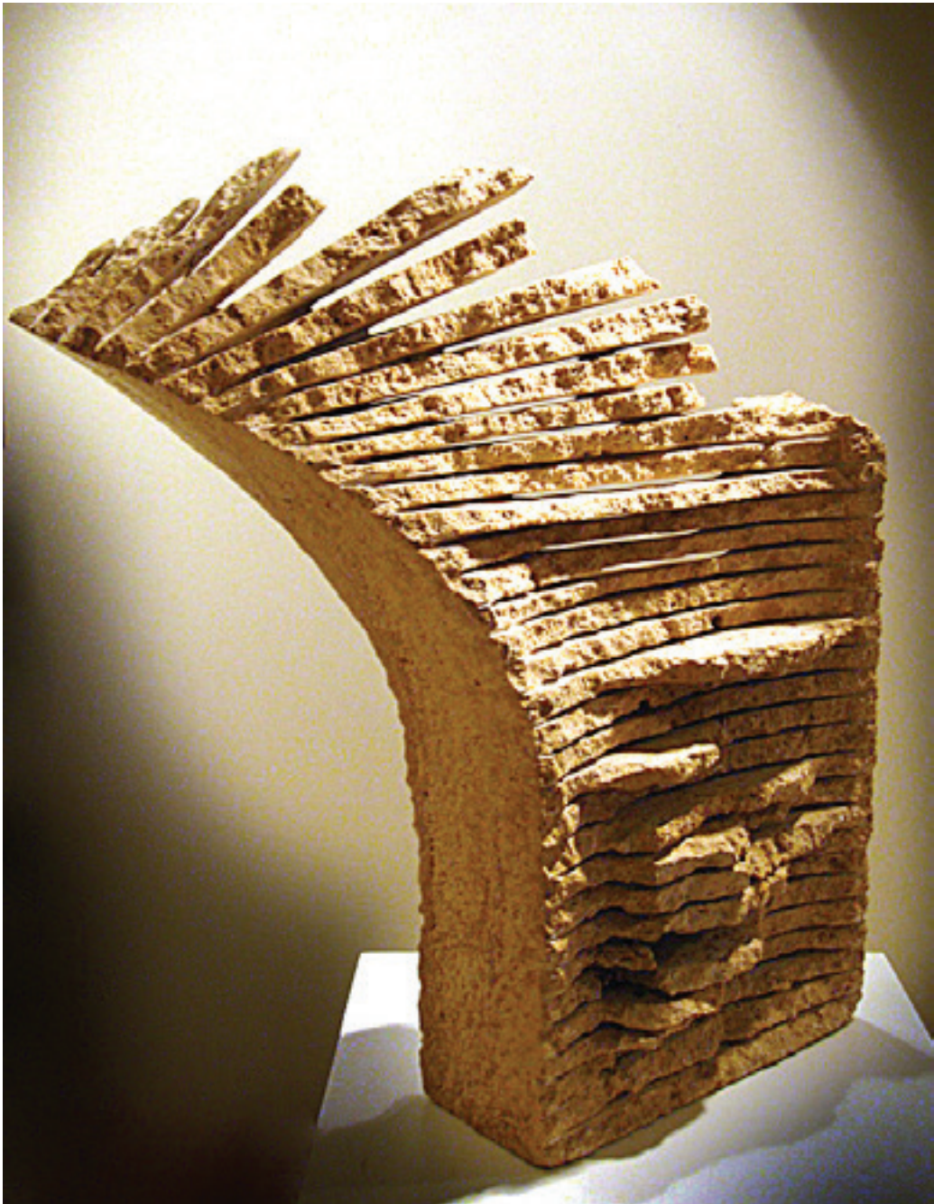
"TUHAF BIR DUYGU" 2004 Kalker 75x40x25 cm