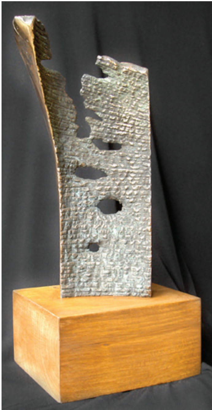
"GERİLİM" 2/6 (2000-2010) Bronz ve Ahşap 39x20x15 cm