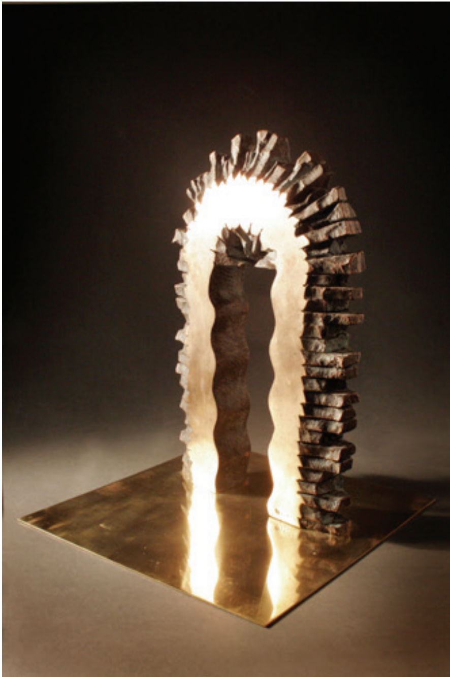
"MISRA" 3/6 (2005-2013) Bronz ve Pirinç 35,5x30x29 cm