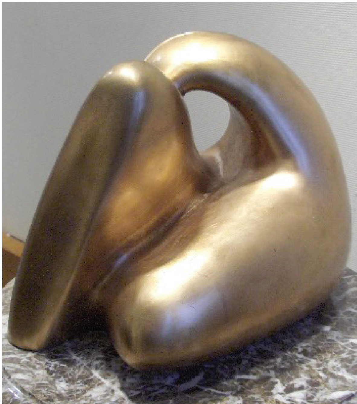
"ADSIZ" 4/6 (1995-2012) Bronz 27,5x37x25 cm